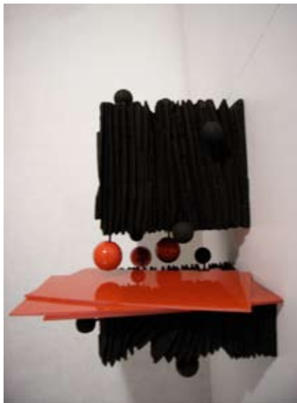
Francastel - Déprime