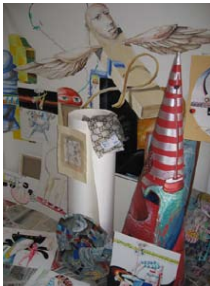
Panayotov - Chambre habitée